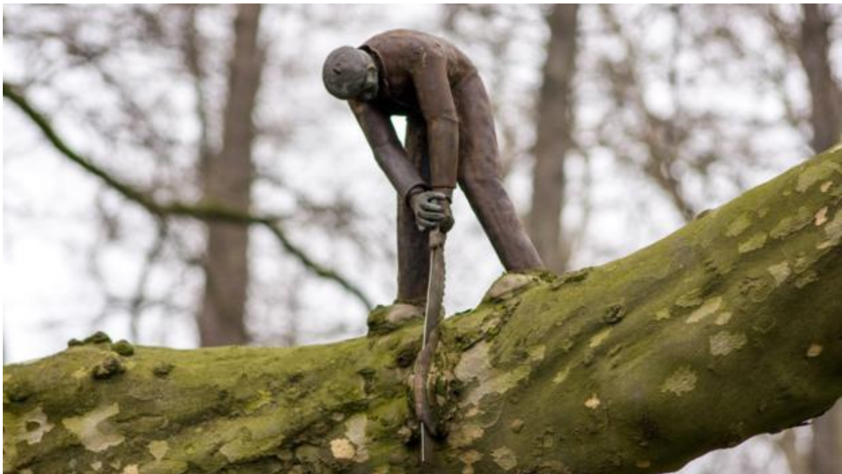
Selbstsabotierendes Verhalten ist eine Reaktion auf das Erreichen unserer Obergrenzen.

Ni empfiehlt, unsere Denkweise durch positive Selbstgespräche zurückzusetzen. „Ersetze den selbstzerstörerischen Gedanken ‚Ich kann nicht‘ durch ‚Ich werde währenddessen dazulernen‘. Oder ‚Ich bin nicht bereit‘ durch ‚Auch keiner der anderen Bewerber für die Stelle ist vollständig bereit, also werde ich dorthin gehen und mein Bestes geben‘“.